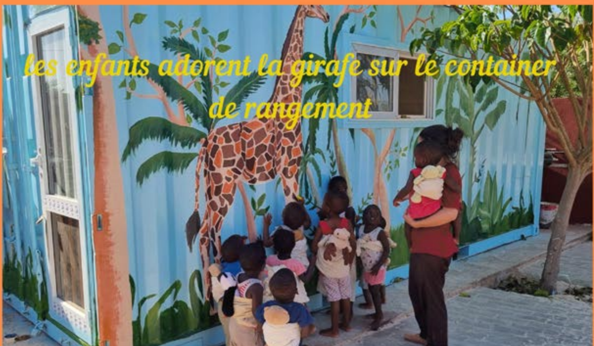
les enfants adorent la girafe sur le container de rangement