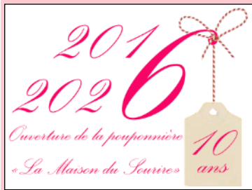
logo spécial 10 ans (apposé avec les signatures sur tous les mails envoyés depuis janvier 2026)

La présidente l'évoque dans son édit, une fête sera organisée à la pouponnière en mars 2027 pour marquer le dixième anniversaire de l'arrivée du premier bébé Coumba. Mais d'ici là, plusieurs éléments de communication sur cet évènement ont déjà été mis en œuvre :