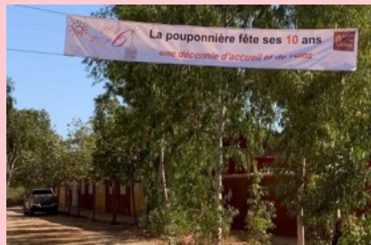
Banderole 10 ans (Tendue sur la route devant la pouponnière en mars 2026)