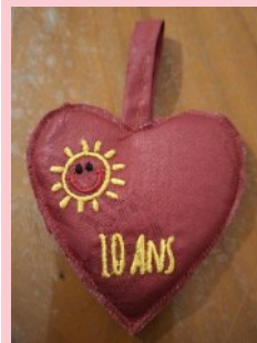
Coeur 10 ans (Petits cœurs brodés sur tissu. Mis à la vente. Un « arbre à Cœurs » est en cours de réalisation qui sera posé à l'accueil de la pouponnière avec autant de cœurs accrochés que la pouponnière a accueilli d'enfants en 10 ans)