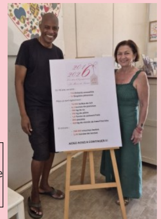
Panneau 10 ans (Posé sur un chevalet à l'accueil de la pouponnière en mars 2026)